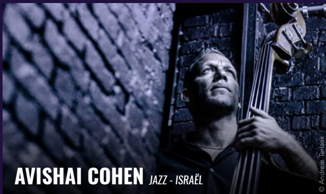
AVISHAI COHEN JAZZ - ISRAËL

Une grande dame du jazz vocal rend un hommage intime et bouleversant à Ella Fitzgerald.