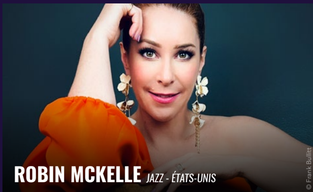
ROBIN MCKELLE JAZZ - ÉTATS-UNIS